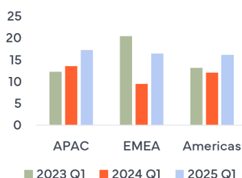
Nettoomsättning per region